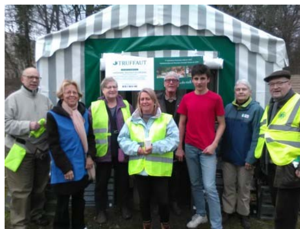
Les Lions, les Amis des forêts et un lycéen

Avant le confinement, notre association a été partie prenante à l'opération « Nettoyons la nature » organisée le 7 mars 2020 par les Lions de Versailles et de l'Île de France, avec le soutien du Conseil départemental des Yvelines et de la Ville de Versailles, ce nettoyage de printemps 2020 s'est déroulé à deux endroits : sur le tronçon de la N10 reliant Versailles et Saint-Cyr et sur la route RD185 entre Versailles et Ville d'Avray. Une dizaine de lycéens sont également venus participer à cette opération qui s'est déroulée sous un ciel gris mais sans pluie... ce qui était presque une aubaine en cette période particulièrement pluvieuse. La bonne humeur était générale et nombreux ont été les passants et promeneurs à féliciter les ramasseurs qui ont rempli une petite dizaine de sacs poubelle (cannettes, bouteilles, lingettes et emballages divers) et ont déniché une cuisinière dans une dépression de terrain.