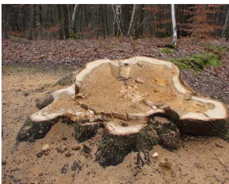
Des coupes de sécurisation, oui...

ancienne, à savoir le taillis sous futaie, et venaient s'ajouter à la nouvelle démarche mieux perçue de la futaie irrégulière. Nous avons demandé à l'ONF une communication sur site plus explicative et réalisée bien avant que les coupes ne commencent, nous avons aussi insisté sur l'impératif de remise en état des chemins en raison de la forte fréquentation de ces forêts périurbaines, d'autant