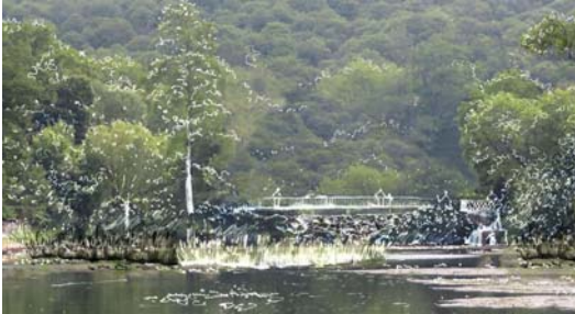
Perspective de la future surverse et de la passerelle, vue depuis l'étang aval./URBAN ECO SCOP

Les travaux correspondants ont commencé à l'automne 2019. La première phase a consisté à curer le Vieil étang et à créer une nouvelle digue entre les deux étangs avec réalisation d'une surverse qui fera un tiers de la longueur de la digue.