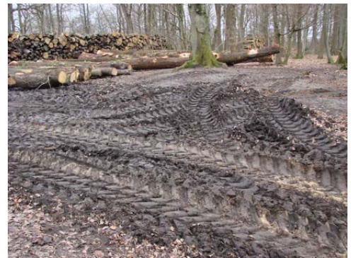
Un paysage hivernal difficile à vivre

Les coupes réalisées au cours de l'hiver 2019/2020 dans le cadre des schémas d'aménagement des massifs forestiers de Versailles et de Fausses-Reposes ont suscité de nombreuses protestations auprès de l'ONF et évidemment de notre association, dont certaines évoquaient d'éventuelles poursuites contre l'Office pour destruction de la nature. Notre association comprend l'émoi des habitants devant ces interventions, parfois brutales, qui modifient l'environnement forestier qui leur est familier, elle essaie néanmoins de leur en expliquer les raisons. Notre association a toujours milité pour que les coupes soient mieux ciblées afin de tenir compte des spécificités périurbaines. Si des avancées ont été enregistrées, le schéma d'aménagement de la forêt approuvé par le ministère de l'Agriculture demeure incontournable et fort contraignant pour les agents de l'O.N.F.