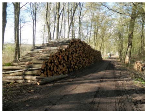
...mais pas que, il faut aussi produire du bois

que les ornières formées lors de ces interventions ont été très profondes du fait des précipitations importantes de cet hiver. Nous espérons avoir été entendus... et des mesures pour éviter les réactions exacerbées des habitants.