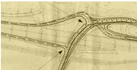
Version EPAPS 2019 – Emprise forestière 700 m 2

Comme nous l'indiquions dans notre lettre d'information N° 35, ce projet conditionne l'aménagement de la ZAC de Satory Ouest. Les études en vue de sa réalisation vont donc bon train. La version de l'Établissement Public d'Aménagement de Paris Saclay (EPAPS) validée par le préfet des Yvelines en présence de François de Mazières, qui nous avait été présentée dans les locaux de VGP en novembre 2019, a été remplacée par une nouvelle version établie par la Direction des routes d'Île-de-France (DiRIF), maître d'ouvrage délégué de l'opération pour le compte de l'État. Cette dernière version présentée à six associations, dont la nôtre, le 6 juin 2020, présente une emprise sur